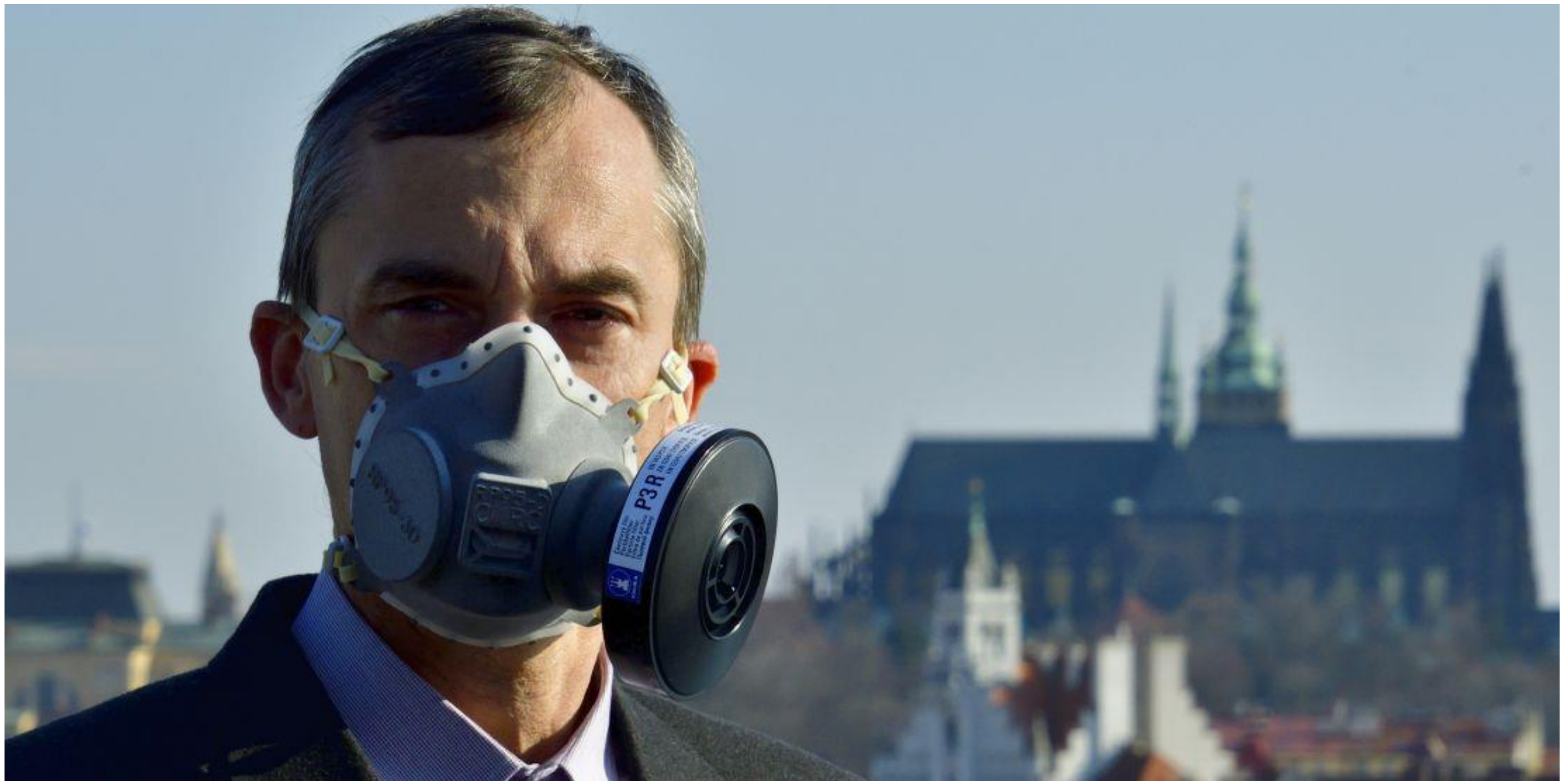
Příklad: Vývoj a sériová výroba respirátoru FFP2, ČVUT CIIRC